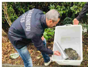
Sequestrata tartaruga azzannatrice abbandonata